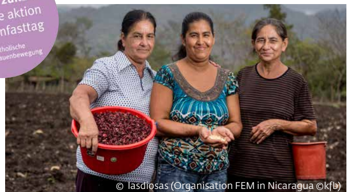
© lasdlosas (Organisation FEM in Nicaragua ©kfb)